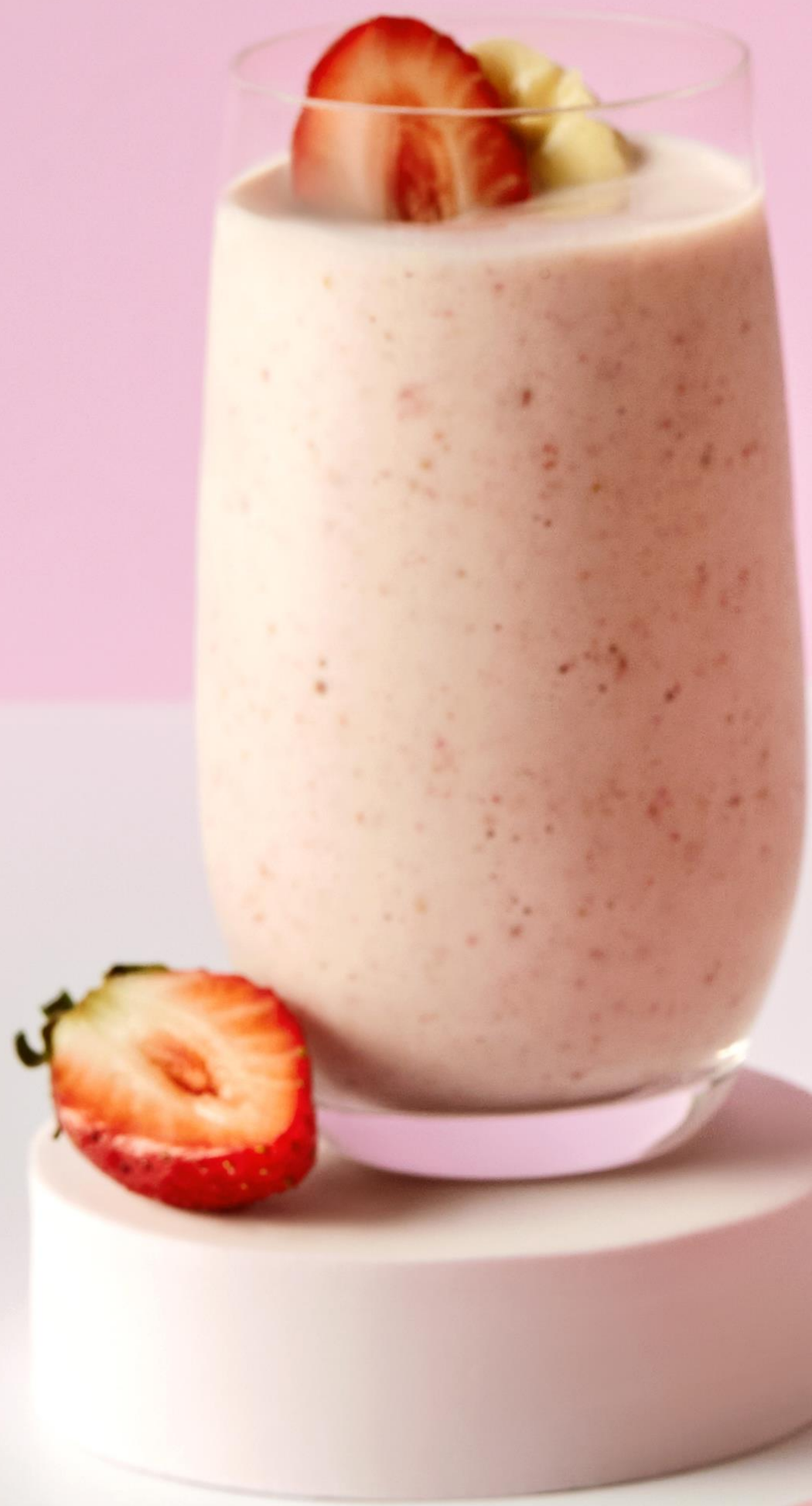
딸기&바나나 주스 Strawberry&Banana Juice 16,000원