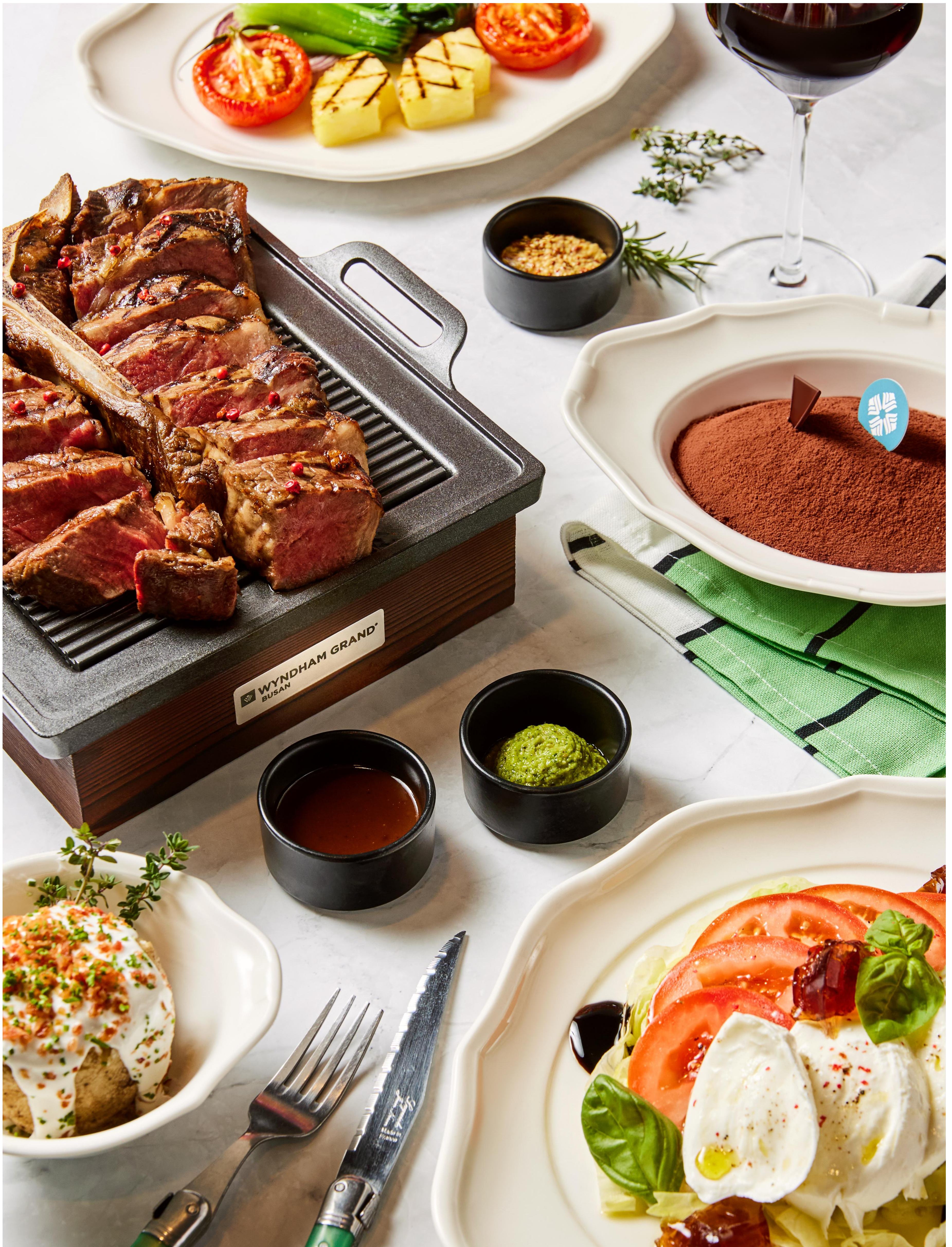
❖ T-bone Tradition Set | 티본 스테이크 세트