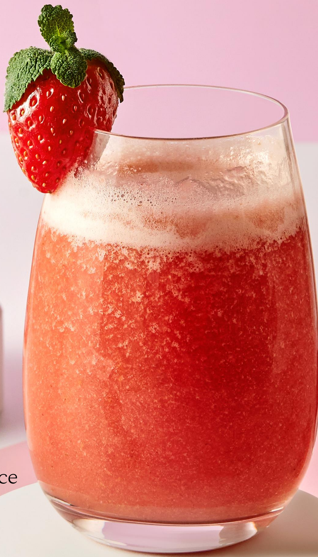
생딸기 주스 Fresh Strawberry Juice 19,000원